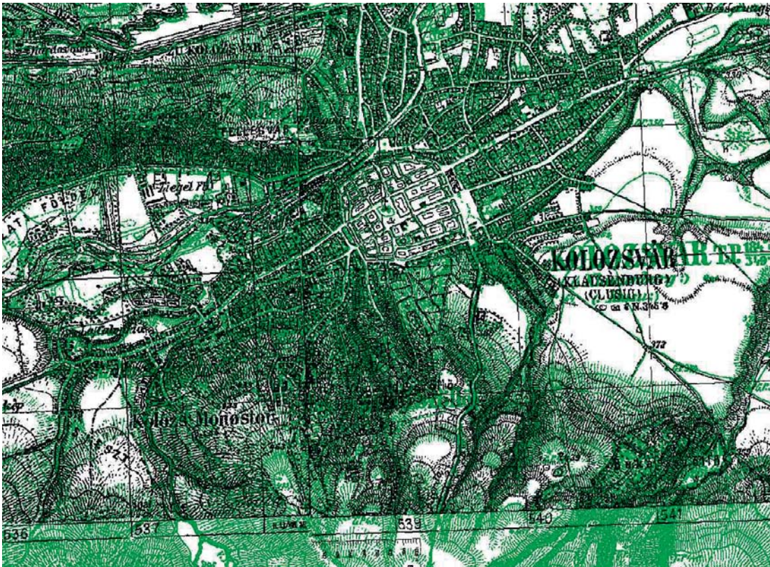
1. Kolozsvár és közvetlen környezete a második (zöld) és a harmadik (fekete) katonai felmérés egymáshoz illesztett térképein. Az illesztés kizárólag a térképek keretének és koordinátarendszereinek felhasználásával, azonos pontok alkalmazása nélkül történt. (Kapcsolódó cikket lásd a 12. oldalon)